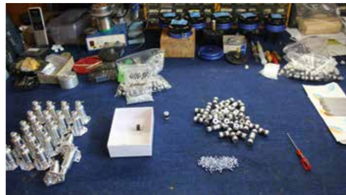
Die Wellenproduktion findet in der Werkstatt von Bauer-Modelle statt