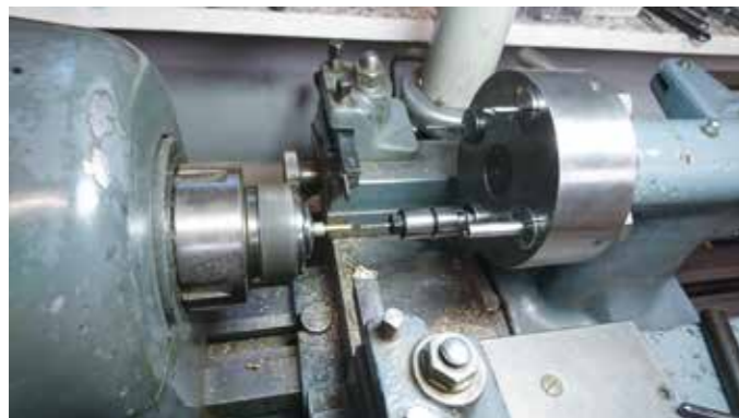
Gewindeschneiden mit einer Drehbank gehören zum täglich Brot von Uwe Bauer