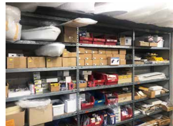
Einiges auf Lager hat Uwe Bauer, um die Wünsche seiner Kunden zu erfüllen