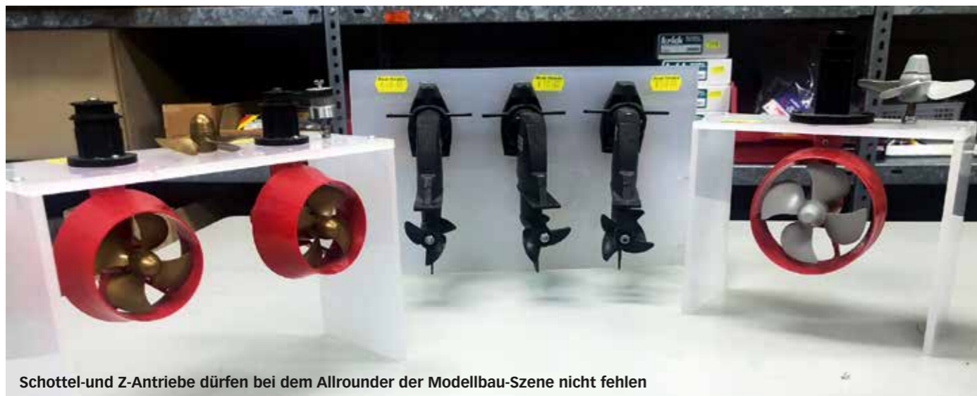
Schottel- und Z-Antriebe dürfen bei dem Allrounder der Modellbau-Szene nicht fehlen

eigenen Produkte, wobei die Artikel anderer Hersteller als Ergänzung und Abrundung des Angebots an den Modellbauer notwendig sind, um alles aus einer Hand anbieten zu können.