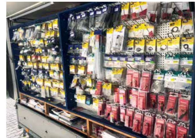
Der Verkaufsanhänger ist ein gern gesehener Gast auf Schiffmodell-Veranstaltungen

Das wichtigste ist, dass unsere Kunden und wir gesund bleiben. Als eine der nächsten Veranstaltungen kann man uns am 20. September beim Schaufahren im Waldschwimmbad Herrenbrücke in 29328 Faßberg antreffen. Für den Herbst ist ein neues Modell eines aktuellen VSP-Schleppers in Zusammenarbeit mit Robert Allan und Voith Schneider in Vorbereitung. Weitere Modelle sind in der Planungsphase. Im 3D-Druck ist neben unseren PLA-Druckern nun ein SLA-Drucker in Betrieb, mit dem unsere Zubehörteile verfeinert und das Angebot auch ständig ergänzt wird. Es bleibt spannend. ■