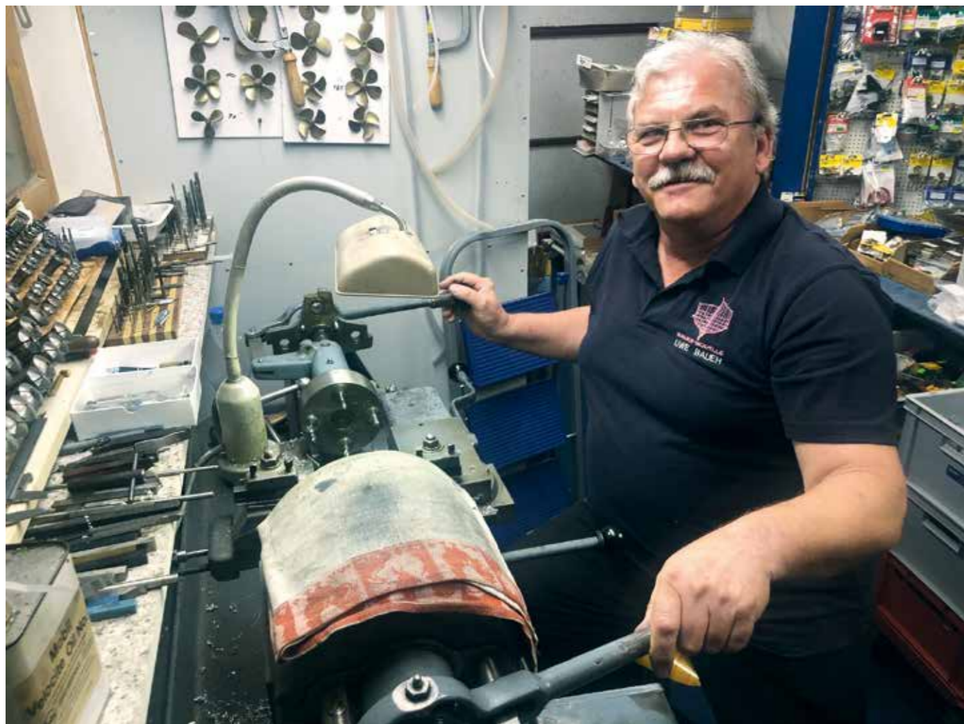
Im Interview: Bauer-Modelle